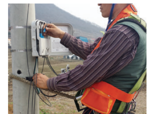
Использование системы ремней на столбе